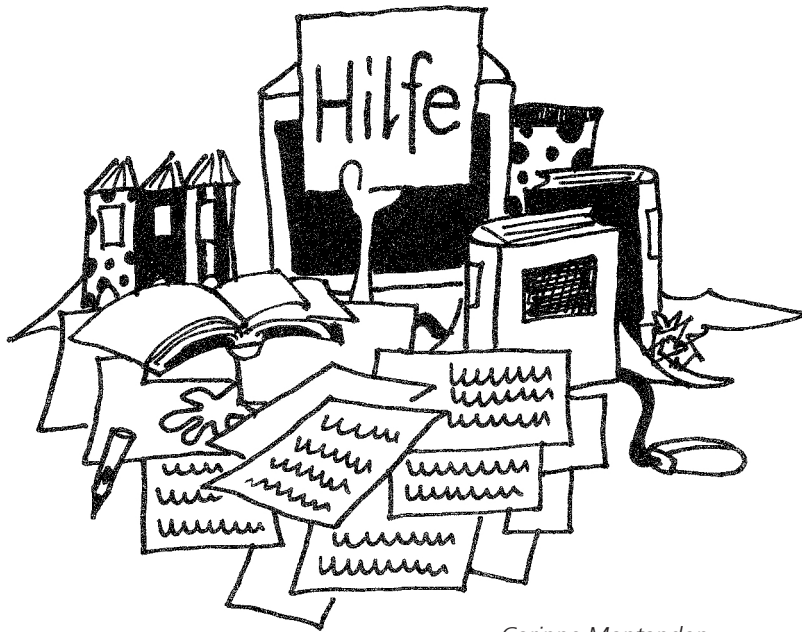
Corinne Montandon in: Das schnittige Schnipselbuch 2, Verlag die neue Schulpraxis